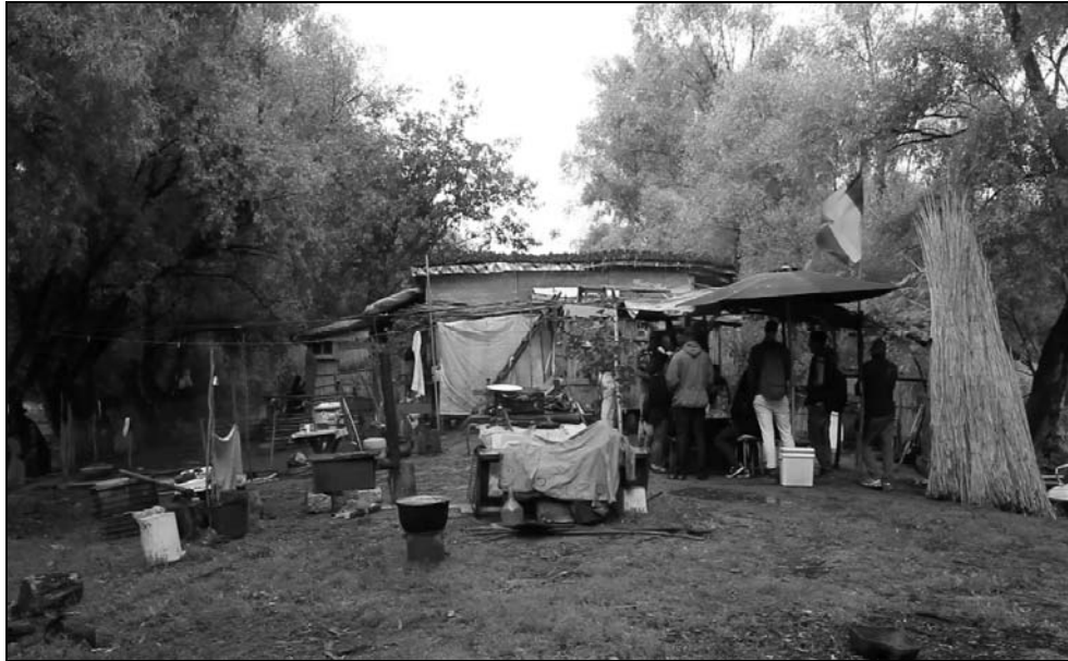
Imagine de pe insulă