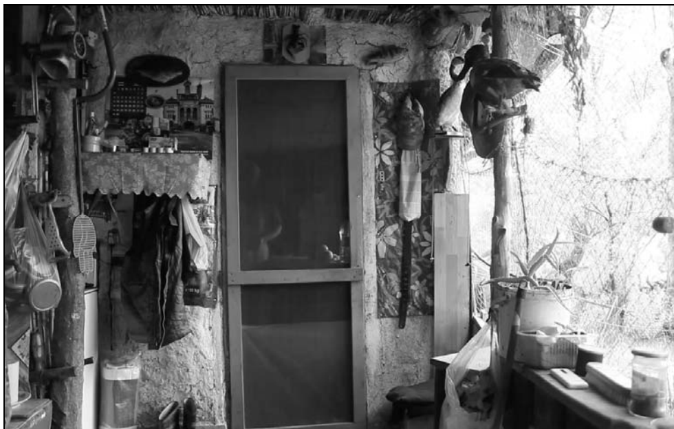
Bucătăria de vară (anticamera) și interior