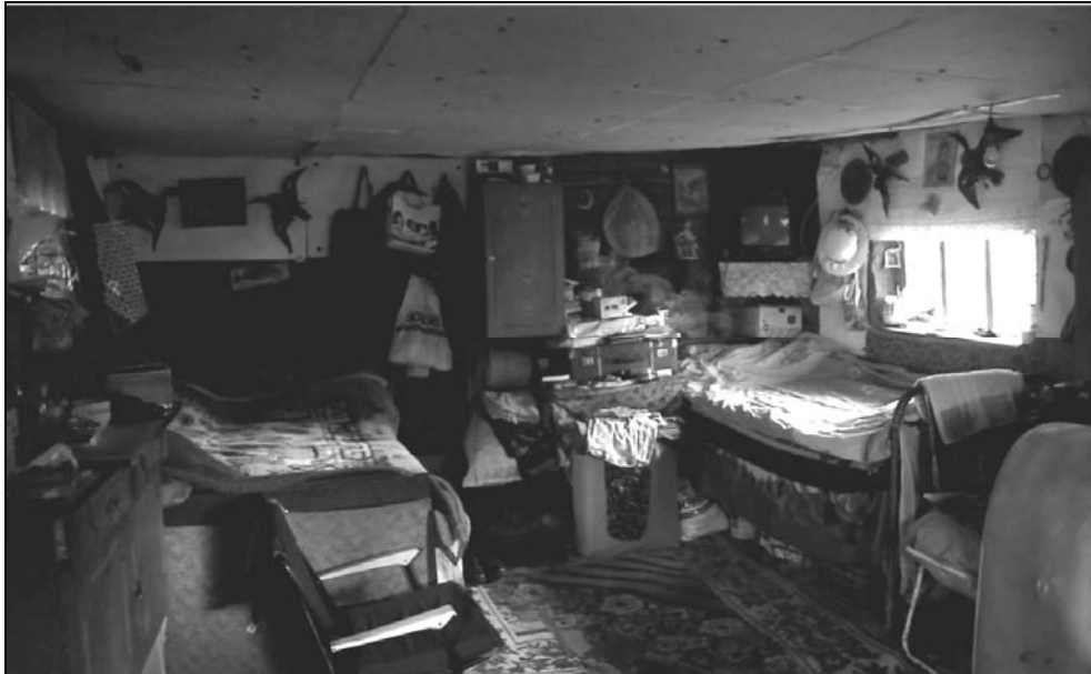
Interior de locuință